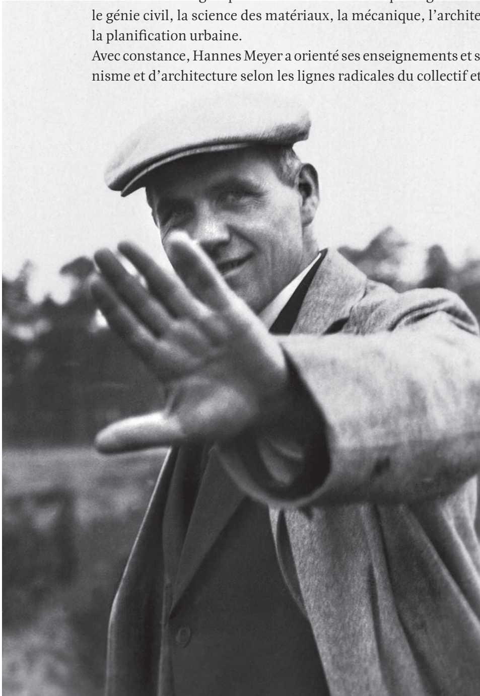
Hannes Meyer surveying the building site of the school of the Federation of German Trade Unions in Bernau by Berlin, 1928

Avec constance, Hannes Meyer a orienté ses enseignements et ses ateliers d'urbanisme et d'architecture selon les lignes radicales du collectif et de ses exigences.