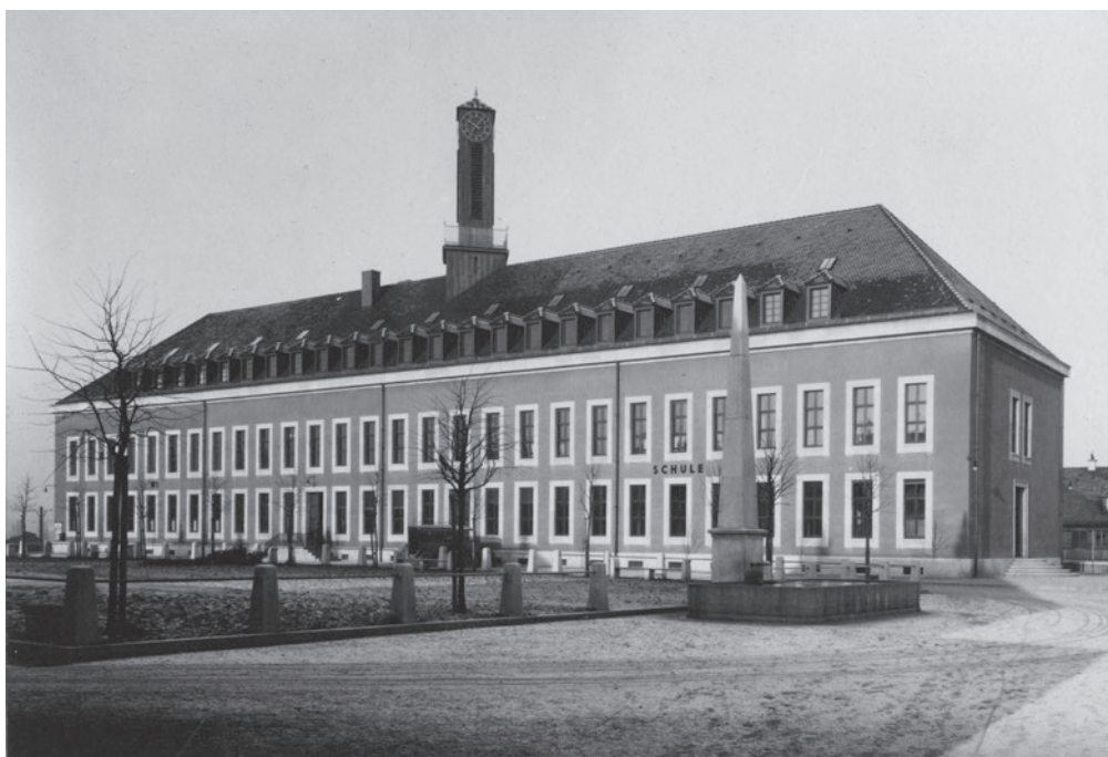
Hannes Meyer, the community building of the co-operative housing estate Freidorf, 1924

Table ronde vendredi 14 octobre à 18:00, Forum d'architectures sur le thème « Coopérer dans la construction aujourd'hui »