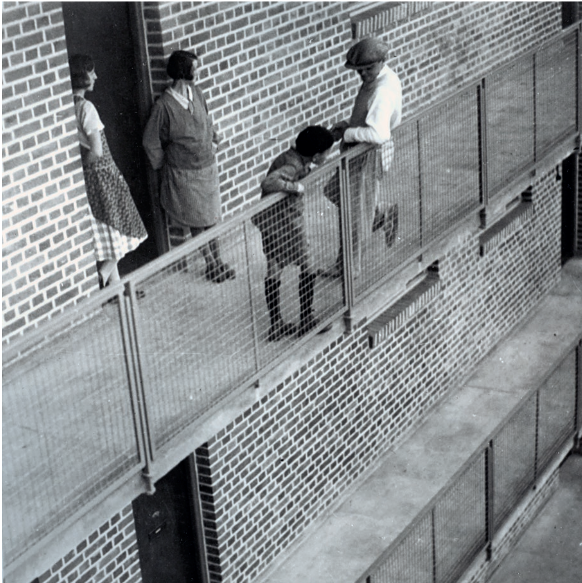
Balcony access houses after completion with residents, photographer unknown, 1930, ©Stiftung Bauhaus Dessau